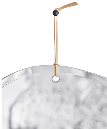
Lien en cuir de kangourou