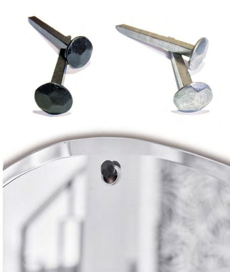
Clous en acier à tête martelée Ø21 mm, L: 40mm